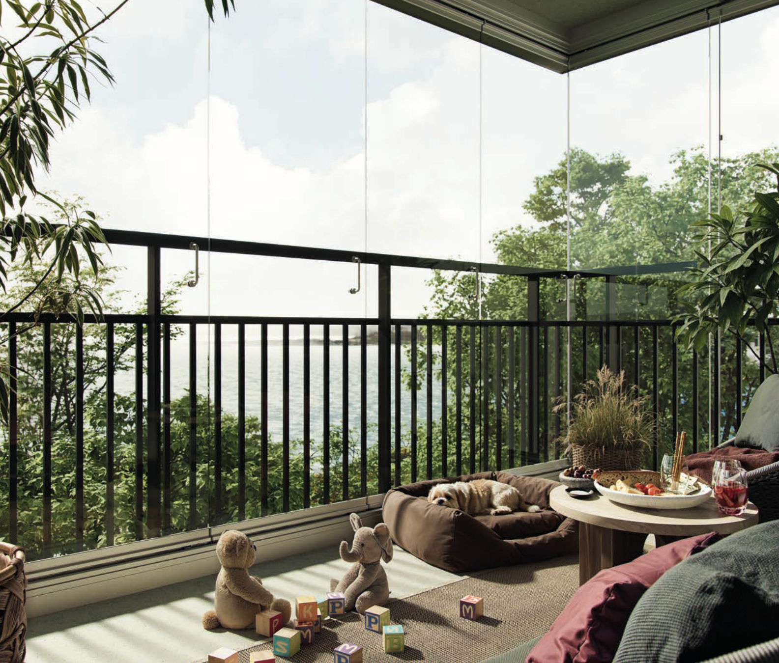
Windoors 410, ramfria våningshöga dörrar