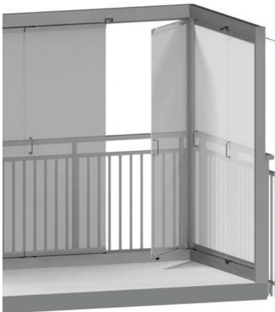
WINDOOR 410, RAMFRIA VÅNINGSHÖGA DÖRRAR