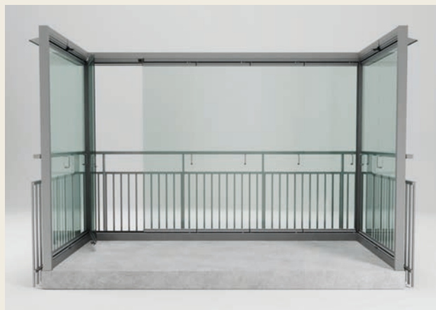
RAMFRIA DÖRRAR MED HÖRNPROFIL.