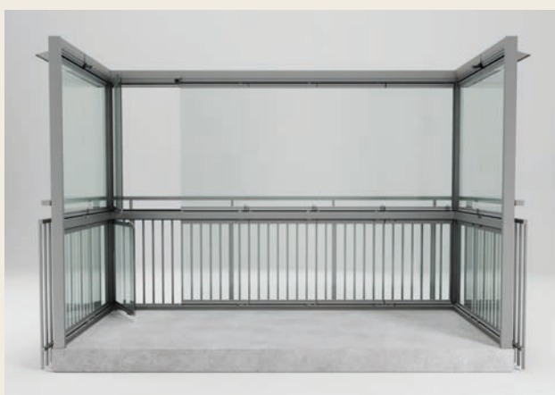
RAMFRIA LUCKOR MED ÖPPNINGSBARA LUCKOR NEDTILL (SPLIT).