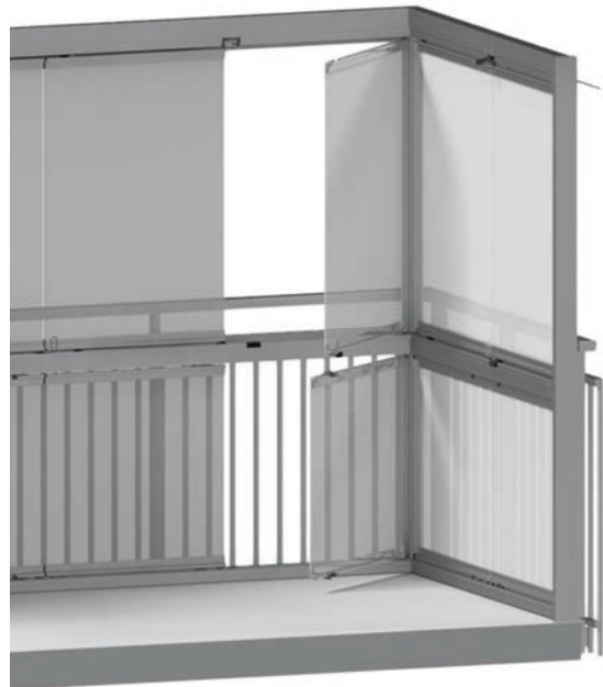
WINDOOR 410 SPLIT, RAMFRIA LUCKOR

Flexibelt skjut- & viksystem med många kombinationsmöjligheter. Kan monteras antingen innanför befintligt balkongräcke eller på balkongräcket.