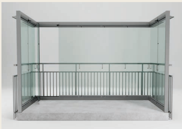
RAMFRIA DÖRRAR MED GLASHÖRN.

Flexibel inglasning som kan monteras innanför befintligt räcke eller kombineras med nytt balkongräcke. Ger stora öppningsmöjligheter och enkel skötsel. Kan anpassas för särskilda lösningar, som bottenplan utan räcke eller översta våning med tak.