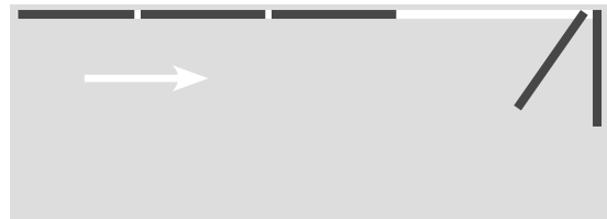
Balkongen sedd uppifrån

Glaspartierna öppnas genom att skjutas åt sidan och sedan vikas inåt balkongen. Det gör att man kan öppna upp helt.