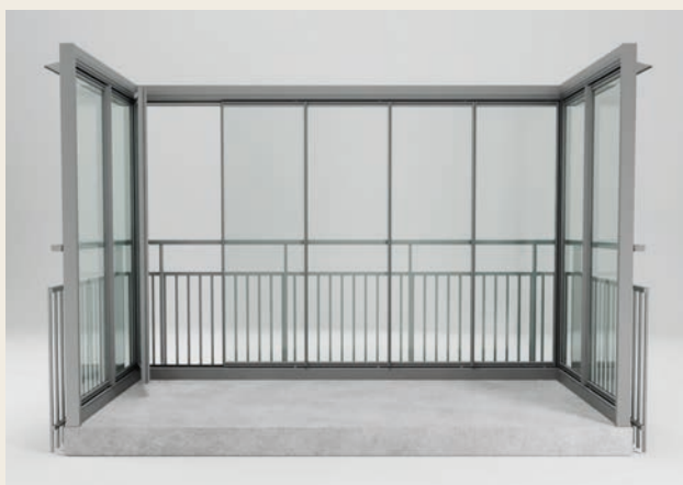
DÖRRAR MED SMAL RAM.