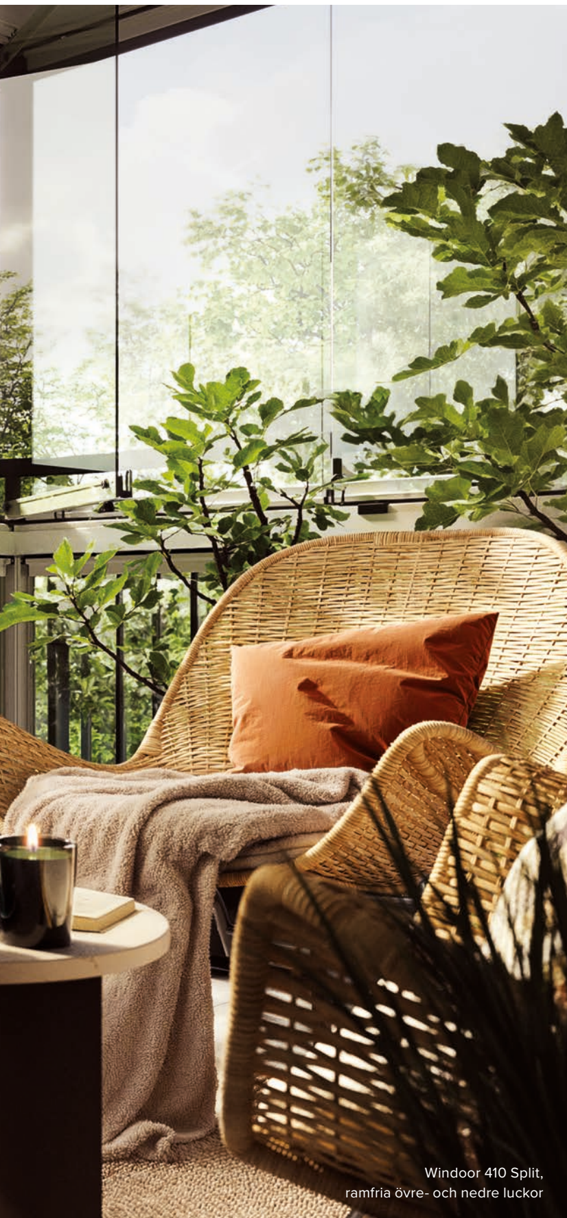
Windoor 410 Split, ramfria övre- och nedre luckor