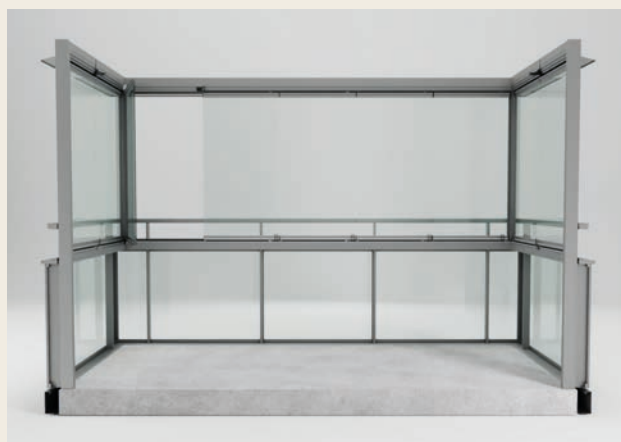
RAMFRIA LUCKOR MED RÄCKE: WINRAIL 660, CANAL.